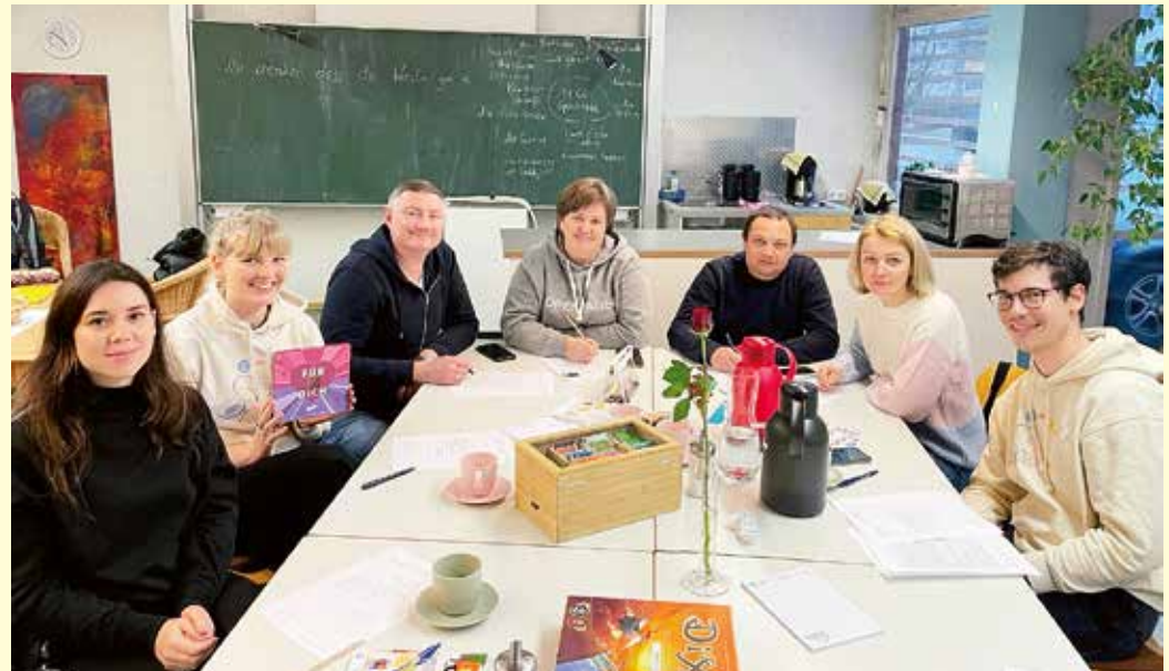
An jedem ersten und dritten Mittwoch im Monat gastiert das mobile Sprachcafé in den Räumen des Internationalen Frauentreffs an der Danziger Straße in Belm. In lockerer Atmosphäre ist das Sprachcafé ein Treffpunkt für Deutschlernende und für Muttersprachlerinnen und Muttersprachler, um den interkulturellen Austausch und das gemeinsame Lernen vor Ort zu fördern.