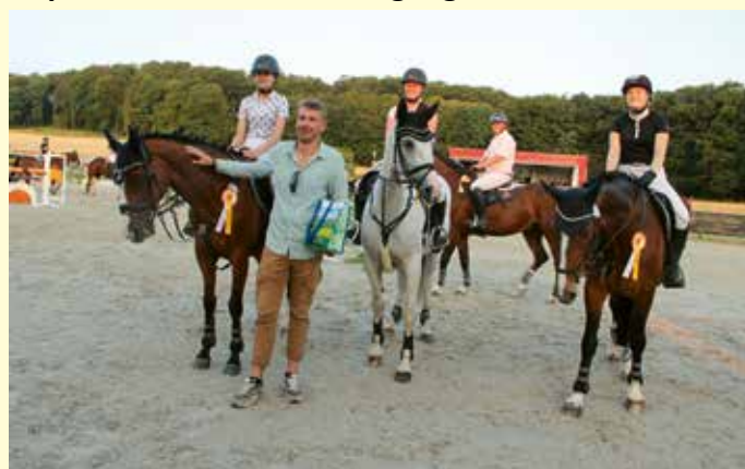
Siegerehrung Piaffe-Team-Cup 2023