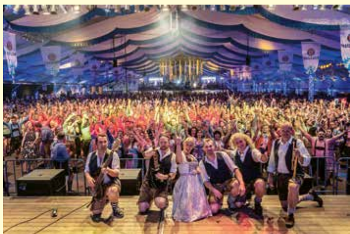
Die Münchner Band 089 wird wie hier zuletzt 2019 das Hollager Festzelt rocken.

In diesem Jahr heißt es zum 21. Mal „O'zapft is“ im Festzelt an der Hansastrasse – und zwar am Freitag, 18. Oktober, sowie am Samstag, 19. Oktober. Beginn ist jeweils um 19 Uhr.